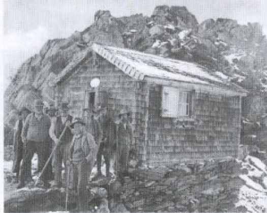
1. Hütte von 1905

Im Jahre 1905 wurde die erste Finsteraarhornhütte gebaut. Das kleine Hüttli hatte am Oberaarjoch ausgedient. Anstatt das Holz wieder auf den Grimselpass zu tragen, wurde es an die SW-Seite des Finsteraarhorns gebracht und wieder aufgebaut.