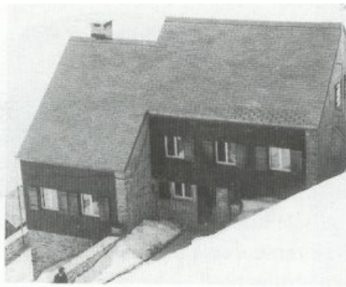
Umbau der 2. Hütte 1969

Mit den Jahren konnte das Hüttli trotz Ausbau nicht mehr genug Platz und Komfort für die immer höheren Besucherzahlen bieten. Also plante die SAC-Sektion Oberhasli den Bau einer neuen Hütte. 1924 wurde am heutigen Standort eine neue Hütte gebaut.