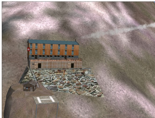
Im FS 9